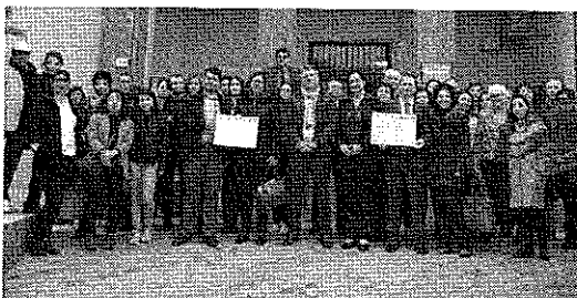
Le delegazioni straniere e gli amministratori davanti al municipio

Nell'aula consiliare del municipio di Sant'Alessio Siculo è stato firmato questa mattina il Patto di fratellanza con Bulgaria, Romania, Spagna e Slovacchia , nell'ambito del progetto europeo di gemellaggio fra città dal titolo "Sharing Solutions for Climate Change: The Voice of Citizens". L'evento rientra nell'iniziativa di gemellaggio promossa dal Comune attraverso il coinvolgimento attivo con quattro municipalità europee, le cui